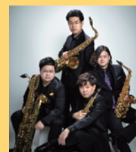
Modétro Saxophone Ensemble [サクソフォン四重奏]