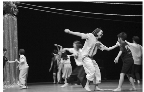
上:糸紡ぎ体験の様子(Bプログラム/京都府立けいはんなホール/アーティスト:浅井信好) 下:公募ワークショップの様子(Cプログラム/荘銀タクト鶴岡/アーティスト:長与江里奈)