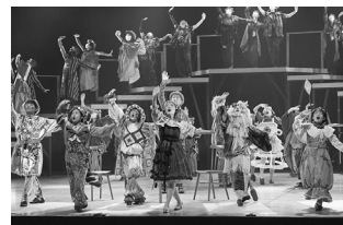
昨年の公演『OZ オズの魔法使い』