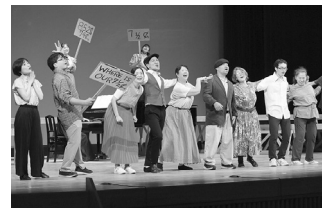
昨年のミュージカル・ワークショップ 成果発表の様子