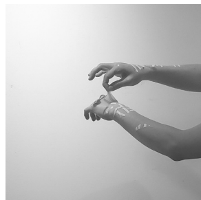
《DAPPI 脱皮》(映像作品の一部)